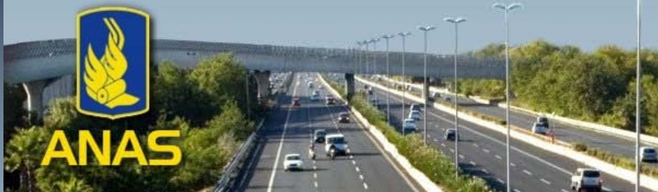
Relazioni con il pubbl