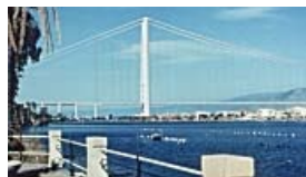
Il ponte sullo stretto di Messina