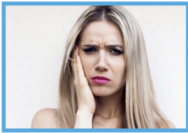
ha il mal di denti